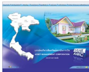
Asset Management System บริษัทบริหารสินทรัพย์สถาบันการเงิน