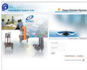
Pump Selector System บริษัทพีเอ็มเอส โพรดักส์ จำกัด