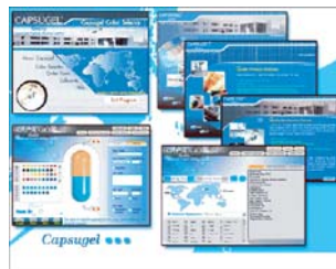
Capsugel Color Selector System บริษัทแคปซูลเจด (ประเทศไทย) จำกัด