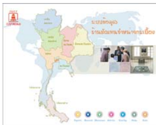
Agent Management System บริษัทไทย-เยอรมัน เซรามิค อินดัสทรี จำกัด มหาชน